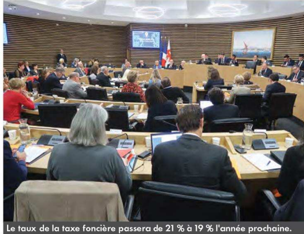
Le taux de la taxe foncière passera de 21 % à 19 % l'année prochaine.